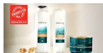
Repara y Protege de Pantene