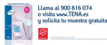
TENA Protective Underwear